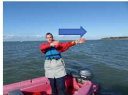
FIGURE 4 DÉPART EN CAS DE COÛTE