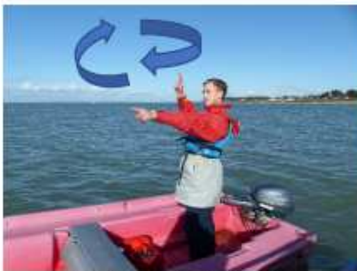
FIGURE 5 FAIRE DÉPARTER