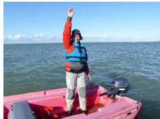
FIGURE 6 TOP DÉPART !