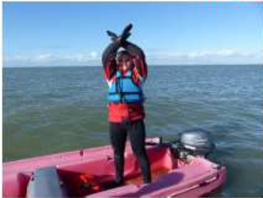
FIGURE 1 ENGAGEMENT À MON DÉPART