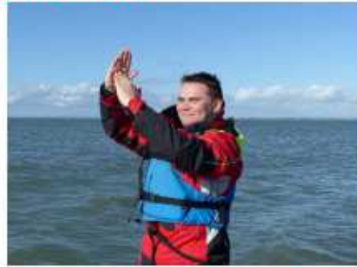
FIGURE 2 STOP ET ARRÊT