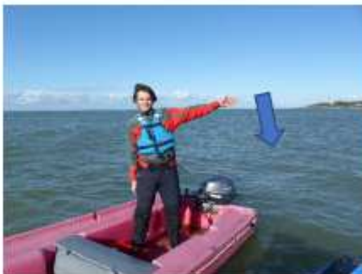
FIGURE 3 VITESSE CONTINUÉE MON NIVEAU DE CE CÔTÉ